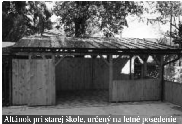
Altánok pri starej škole, určený na letné posedenie

Technický podnik ukončil úpravu dvora starej školy a stavbu letného posedenia. Vďaka poslancom obecného zastupiteľstva, ktorí podporili