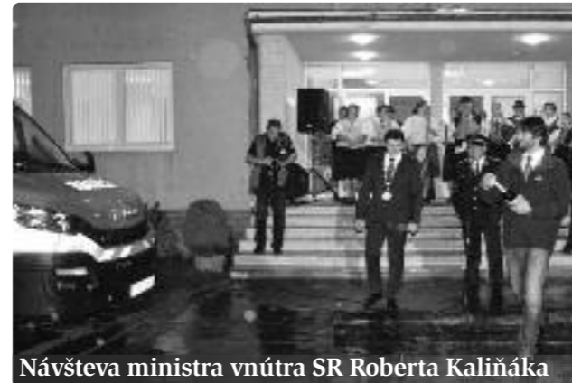
Návšteva ministra vnútra SR Roberta Kaliňáka

V piatok 18. 9. 2015 sme v našej obci privítali vzácnu návštevu – podpredsedu vlády a ministra vnútra SR p. Roberta Kaliňáka s delegáciou. Účelom jeho návštevy bolo osobné odovzdanie nového hasičského auta IVECO – DAILY a protipovodňového vozíka s potrebnou výbavou v celkovej hodnote cca 190 000 € našim hasičom.