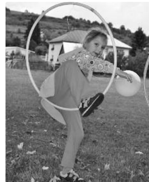
Malý prázdninový návrat, zdolávanie prekážky.