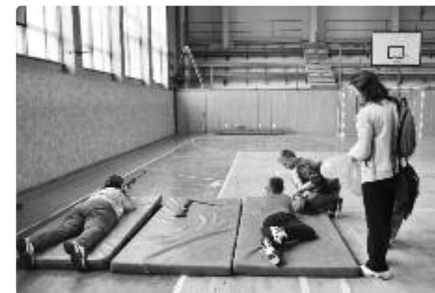
Strelba na cieľ zo vzduchovky