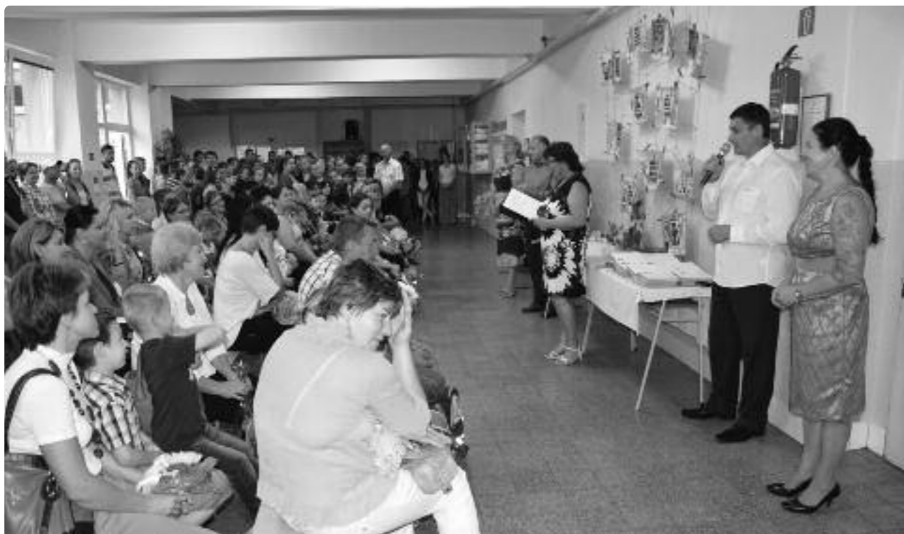
Slávnostné otvorenie školského roka 2015–2016